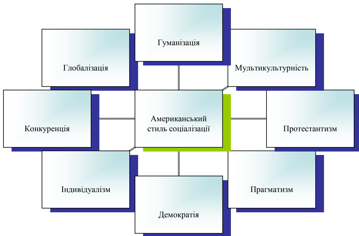
Рис.1. Визначальні чинники формування американського стилю соціалізації

Якщо екзистенціалісти вважають, що вільний вибір людини визначає внутрішню природу, біхевіористи (від behavior - поведінка) переконані, що людину творить середовище. Біхевіористичні традиції розвинулися з переконання, що розвиток - це поведінка, якій навчаються, набуваючи досвіду через спілкування з оточенням.